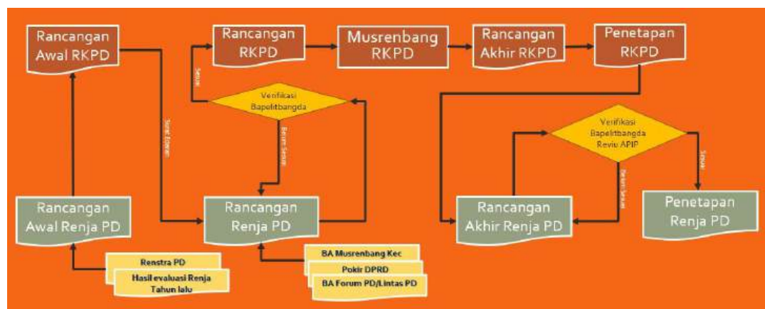
Gambar 1 Tahapan Penyusunan Renja Perangkat Daerah

Adapun Keterkaitan Renja Perangkat Daerah dengan dokumen RKPD dan Renstra Perangkat Daerah merupakan satu kesatuan yang tidak dapat dipisahkan karena didalam Renja Perangkat Daerah merupakan penjabaran dan adanya hubungan keselarasan dengan dokumen daerah yang ada di atasnya seperti RPJMD, Renstra Perangkat Daerah dan RKPD. Sedangkan RKPD dijadikan dasar penyusunan Rancangan Anggaran Pendapatan dan Belanja Daerah (RAPBD), Kebijakan Umum Anggaran (KUA) dan Prioritas Plafon Anggaran Sementara (PPAS). Sementara itu Renja Perangkat Daerah digunakan sebagai dasar penyusunan Rencana Kerja Anggaran (RKA) Perangkat Daerah untuk penyusunan Anggaran Pendapatan dan Belanja Daerah (APBD) Kabupaten/Kota dan sebagai dasar pengusulan program/kegiatan yang akan dibiayai APBD Provinsi dan APBN.